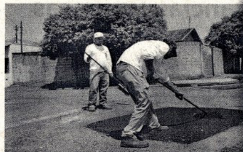
No início do mês, a operação tapa-buraco atendeu a Rua Jair Garcia, no Jardim das Oliveiras